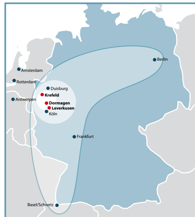
Einzugsgebiet der Chemion Schienenlogistik

Die Schienenlogistik der Chemion reicht weit über die Werkstore hinaus. Durch intensive Kooperationen mit anderen Eisenbahn-Verkehrsunternehmen eröffnen wir Ihnen ab Werk den Anschluss an wichtige Fernverkehrsrelationen. Ein Beispiel für diese Vernetzung ist die Zusammenarbeit mit der Havelländischen Eisenbahn AG: Unser Ost-West-Express verbindet regelmäßig die Standorte Köln-Eifelort und das Rail & Logistik Center (RLC) Wustermark. Das RLC verfügt über große Lagerkapazitäten für Güter aller Art und – als funktionale Einheit mit dem nahe gelegenen trimodalen Güterverkehrszentrum Berlin-West – über gute Anbindungen an das Bundeswasserstraßen- und Autobahnnetz.